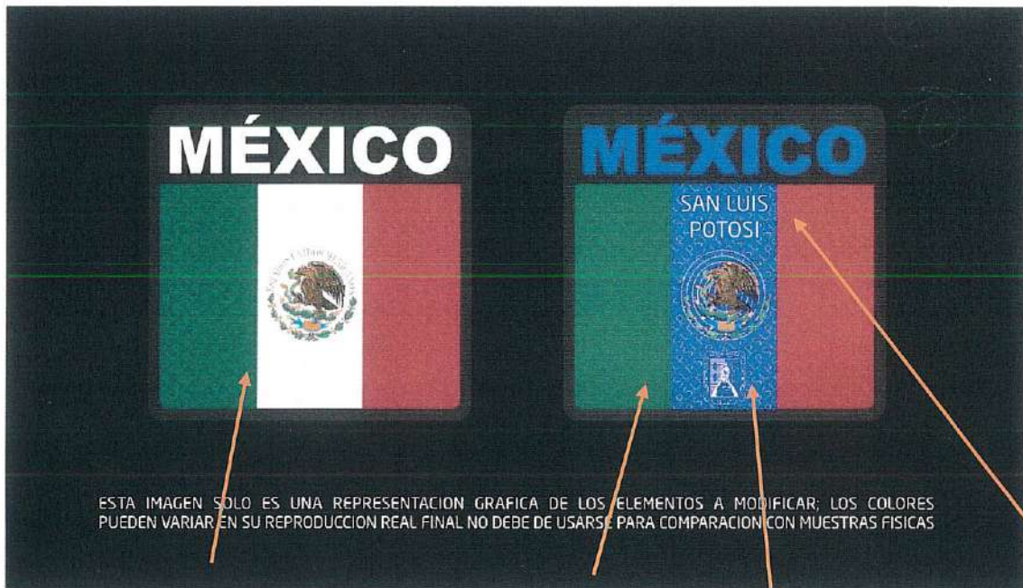
Vista con luz natural

Bandera de México para hombro izquierdo de camisa y chamarra.