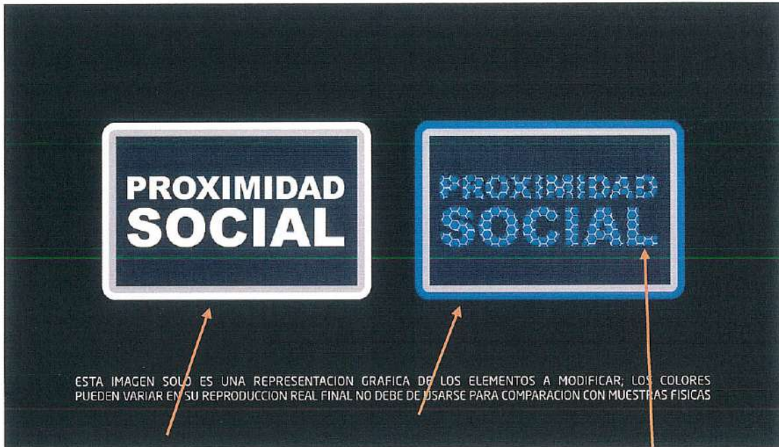
Vista con luz natural

Sector de Proximidad Social. Deberán tener en la codificación UV un panel que se distinguirá solamente en la Palabra Proximidad Social, medida 5cm alto por 7.62 de ancho bordado en la manga derecha.